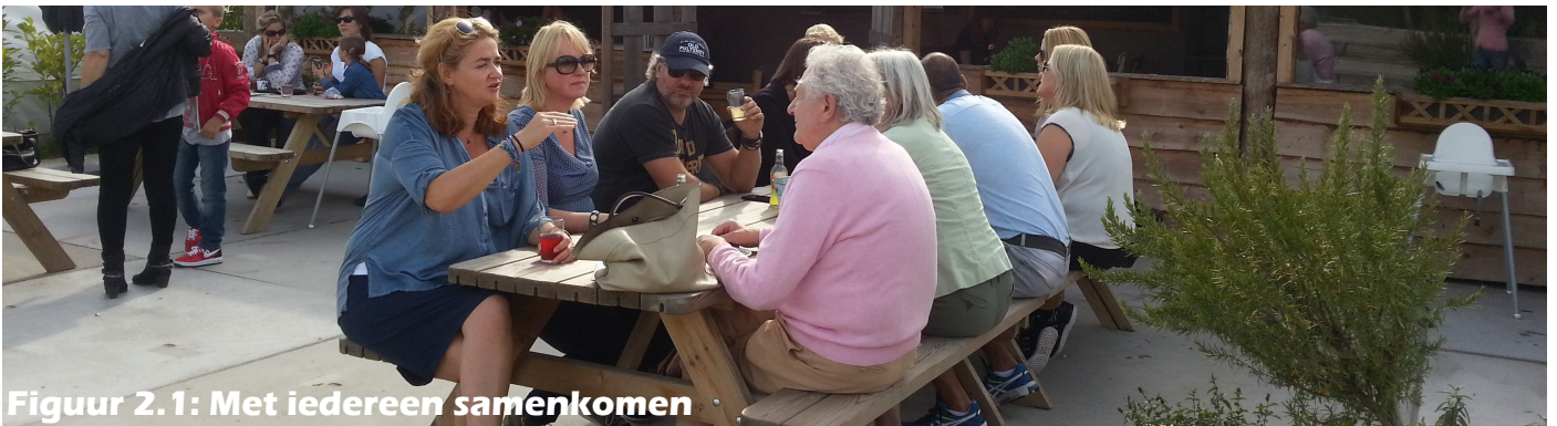
Figuur 2.1: Met iedereen samenkomen

Dementie is (er) welzijn is een concept wat bedacht is om mensen met een lichte vorm van dementie zo lang mogelijk mee te laten doen in de maatschappij. Het idee is om een beleef/ontmoetingspark te creëren binnen het Slotpark. Het Slotpark is momenteel een park waar de ruimte is om samen te komen, te genieten van de natuur, te wandelen en te ontspannen. Het is ook een park waar mensen van alle leeftijden samen kunnen komen. Echter, op dit moment wordt het park nog niet optimaal gebruikt. Het is onder andere nog niet geschikt voor mensen met dementie. Het park is te open en biedt weinig genegenheid en veiligheid voor mensen met dementie. Door een gedeelte van dit park om te toveren tot beleefpark zal het beter aansluiten op de behoeften en welzijn van mensen met dementie.