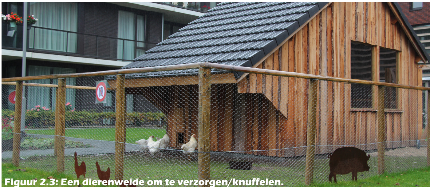
Figuur 2.3: Een dierenweide om te verzorgen/knuffelen.