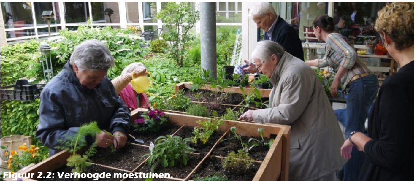
Figuur 2.2: Verhoogde moestuinen.

Binnen deze beleefstuin zal ook ruimte gecreëerd worden voor natuurlijk spelen voor de kinderen en therapeutische plekken voor mensen met dementie zoals een structuren pad wat gemaakt is van verschillende materialen. Dit pad kan mensen met dementie helpen om beweging te stimuleren. Binnen deze beleefstuin zal er een route (tweerichtings) van en naar wijkcentrum "De Slotjes" aangebracht worden. Dit kan mensen met dementie helpen de beleefstuin te vinden. Mochten zij toch verdwalen dan kunnen zij door het volgen van deze route terugkomen bij het wijkcentrum waar iemand aanwezig is met kennis van dementie die deze mensen verder kan helpen. Deze route wordt aangebracht door middel van belettering op de bestrating in en rondom de beleefstuin. Zie figuur 2.4 voor een overzicht van de nieuwe situatie.